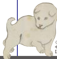
《人物花鳥図巻(部分)》中村芳中 真田宝物館蔵【展示期間】通期(巻替あり)