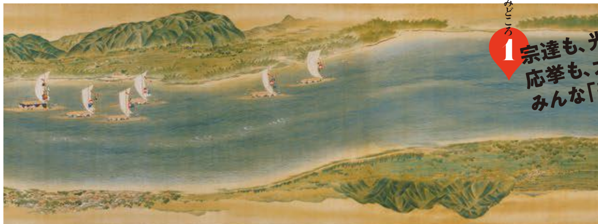
《淀川両岸図巻(部分)》円山応挙 アルカンシエール美術財団蔵【展示期間】5月26日~6月21日