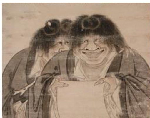
《寒山拾得図》狩野山雪 京都・真正極楽寺 真如堂蔵 重要文化財 【展示期間】5月26日~6月21日

2 北は松前から、南は長崎まで。 江戸時代、諸国に展開した 「奇才」ムーブメントを一望！