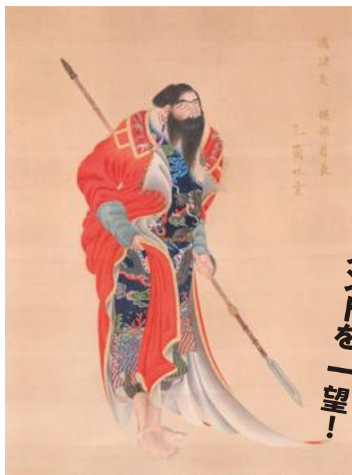
《御味方蝦夷之図イコイ》蠣崎波響 函館市中央図書館蔵【展示期間】4月25日~5月24日

2 北は松前から、南は長崎まで。 江戸時代、諸国に展開した 「奇才」ムーブメントを一望！