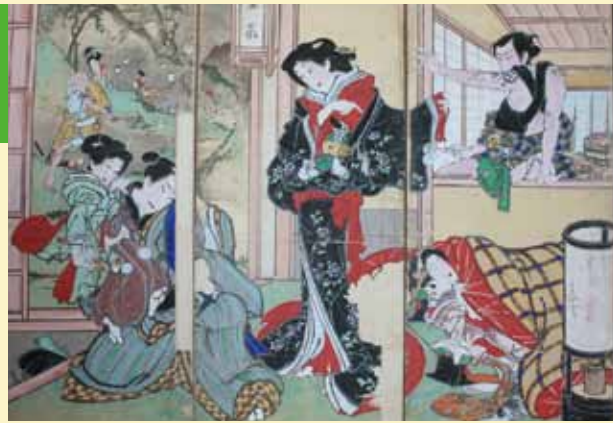
▲義経千本桜 鮎屋 (浅上王子宮所蔵)

絵金が大成した芝居絵屏風は、現在も土佐各地の夏祭りで見ることができます。飾られ方は地域によって異なり、時代によって変化しながらも土佐の夏祭りを彩り続けています。今回は香南市香我美町にある浅上王子宮の作品を展示いたします。また南国市で新しく発見された絵金派の白描画を初公開します。