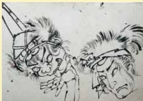
▲菅原伝授手習鑑 (個人所蔵)