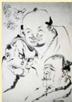
▲三人上戸 (個人所蔵)