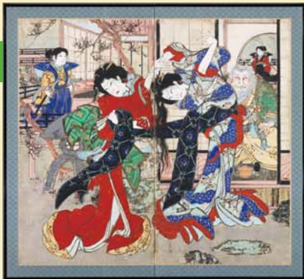
▲蝶花形名歌島台 小坂部館 (本町二区所蔵)